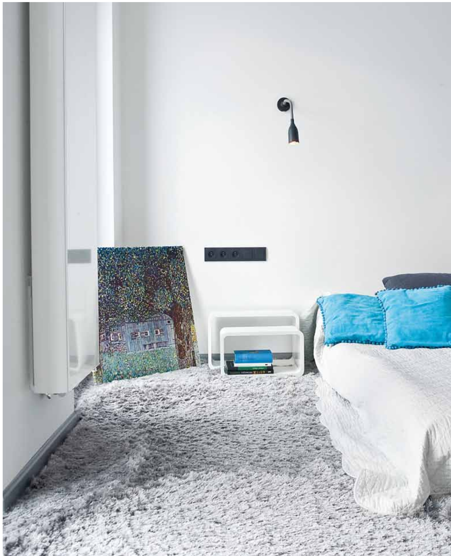
Dodatki w postaci błękitu na poduszkach oraz fioletu fotela zostały zainspirowane gamą kolorystyczną obrazu Gustava Klimta pt. „Farma”.